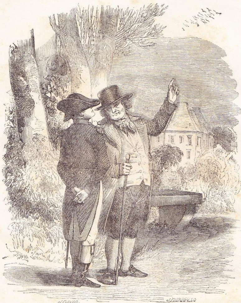
Vous voyez cet essaim d'oiseaux qui fendent la nue ? eh bien, il n'y en a pas un là qui ne sente de loin l'odeur de la poudre et ne flaire le fusil d'un chasseur. (Chap. IV.)

trente-neuf ans, dans les bras de son beau-frère Fesch et de son fils aîné Joseph, qui l'avaient accompagné. Il fut inhumé dans un des caveaux des Révérends Pères Cordeliers de la ville, le 24 février 1785.